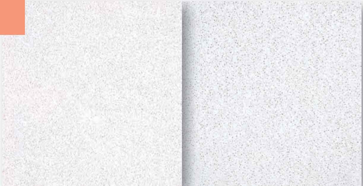
Sandila 70/0 (zonder perforatie)