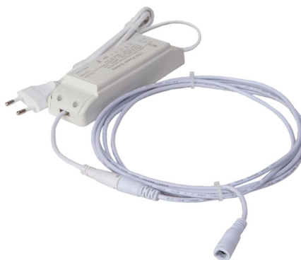
LED verlengkabel met voeding aan de andere einde komt het LED paneel