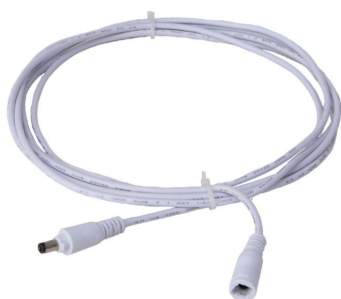
LED verlengkabel artikel 2029 lang 3 meter

C - Indien u de voeding uit het zicht wilt hebben en niet op het LED paneel geplaatst, hebben we 2 typen LED verlengkabel pro waarvan één kabel 2 meter en de andere 3 meter lang is en tussen voeding en LED paneel wordt geplaatst. Deze verlengkabel past niet op alle fabrikaten voedingen, maar past altijd op een bij die kabel gerelateerd LED product van ons.